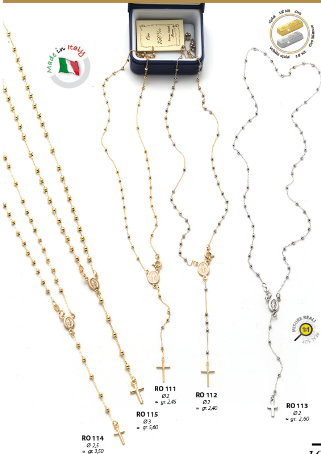
RO 114 Ø 2,5 ≈ gr. 3,50