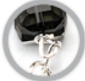
RA 202 Ø 8