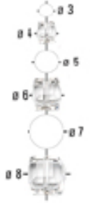
RA 001 Ø 6